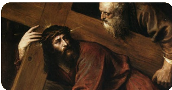
3. La Eucaristía y la llamada a la santidad