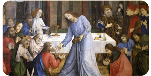
2. La Presencia Real y el culto eucarístico