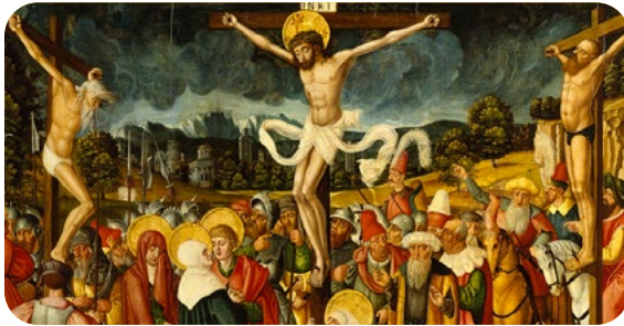
1. El Misterio Pascual y la Eucaristía

Durante este Año del Avivamiento Parroquial, animamos a los párrocos a poner en práctica una serie de homilías dominicales dedicadas exclusivamente a la Eucaristía. El culto eucarístico y las implicaciones de este culto son vitales para toda nuestra vida. Estas homilías podrían abarcar