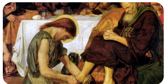
4. La Eucaristía y la llamada a evangelizar y servir 1